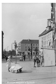
Kolejka do budki z lodami MMTy/F/1846/5