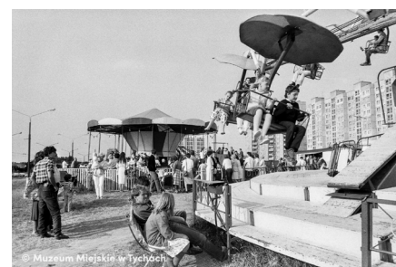
Wesołe miasteczko – abc.tychy.pl MMTy/F/2581/5