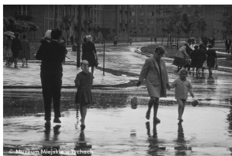
Po deszczu – abc.tychy.pl MMTy/F/2429