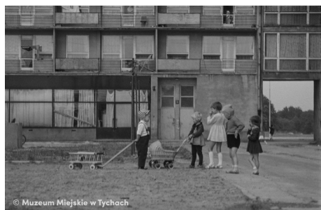
Dzieci z wózkami – abc.tychy.pl MMTy/F/2443