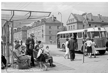
Przystanek autobusowy MMTy/F/65/113