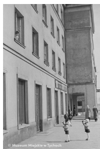
Rozmowa przez okno – abc.tychy.pl MMTy/F/65/99