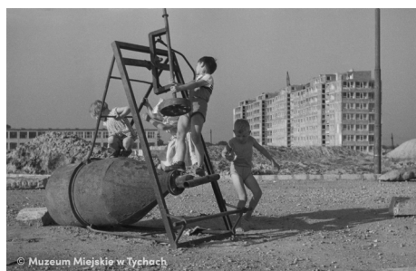
Zabawa przy betoniarce – abc.tychy.pl MMTy/F/2440