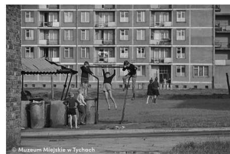
Zabawa na trzepaku MMTy/F/2422