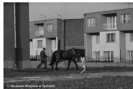
Porządkowanie broni – abc.tychy.pl MMTy/F/2430