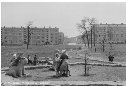
Park Niedźwiadków – abc.tychy.pl MMTy/F/2114/1