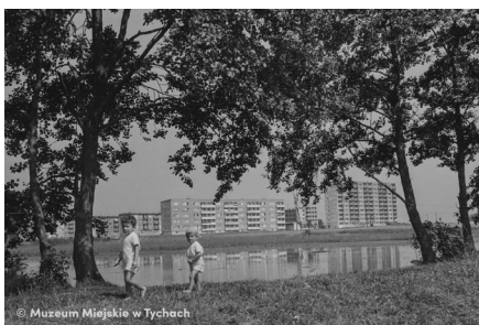
Spacer nad wodą – abc.tychy.pl MMTy/F/2145/4