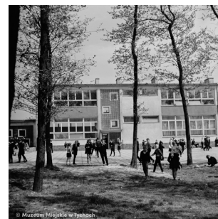
Uczniowie przed szkołą MMTy/F/2475/1