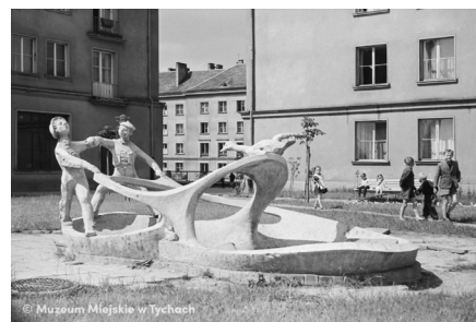
„Chłopcy z gęsią” MMTy/F/65/72