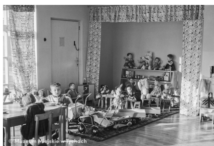
Posiłek w przedszkolu MMTy/F/1914/15