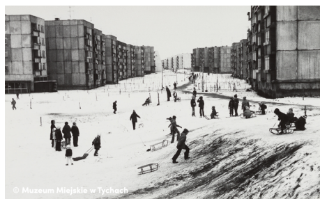
„Zima” – abc.tychy.pl MMTy/F/541/9