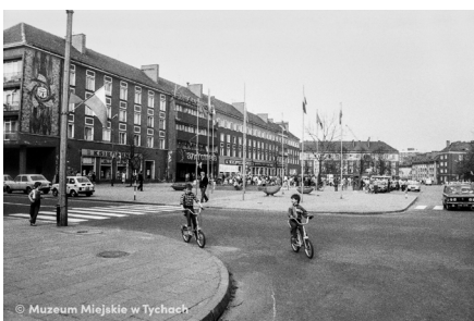
Plac Bolesława Bieruta MMTy/F/2597