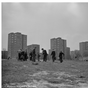
Powrót ze szkoły – abc.tychy.pl MMTy/F/2473