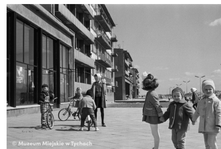
Zabawa na osiedlu D – abc.tychy.pl MMTy/F/2098/20