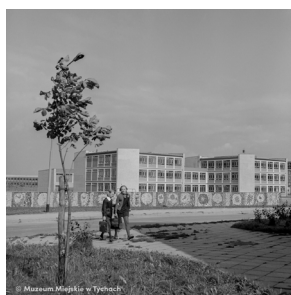
Szkoła Podstawowa nr 18 – abc.tychy.pl MMTy/F/2185/1