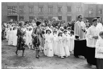
Pierwsza komunia w kościele pw. św. Krzysztofa – abc.tychy.pl MMTy/F/699/3