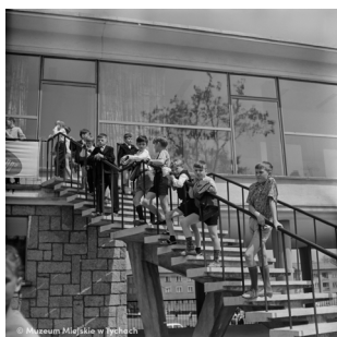
Dni Oświaty, Książki i Prasy – abc.tychy.pl MMTy/F/2505/2