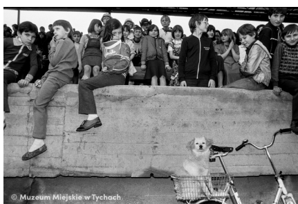
Tyskie Spotkania Młodości – abc.tychy.pl MMTy/F/2578/1