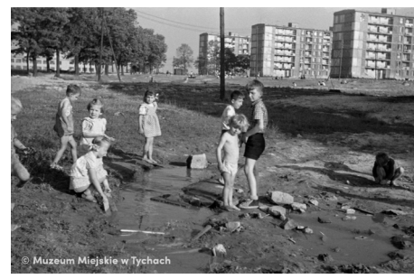
Zabawa w kałuży – abc.tychy.pl MMTy/F/2438