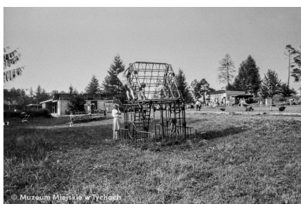
Festyn w Paprocanych MMTy/F/2586/3