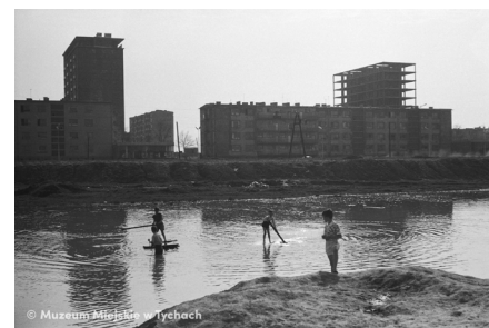
Zabawa w wodzie – abc.tychy.pl MMTy/F/1963/2