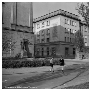
Pod Domem Kultury na osiedlu A – abc.tychy.pl MMTy/F/2488