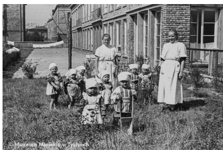
Żłobek tygodniowy – abc.tychy.pl MMTy/F/1821/1