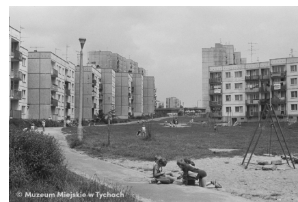
Plac zabaw na osiedlu T – abc.tychy.pl MMTy/F/2225/2