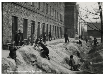
Zabawa w wykopie – abc.tychy.pl MMTy/F/1373