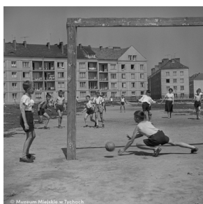
Gra w piłkę nożną – abc.tychy.pl MMTy/F/2556