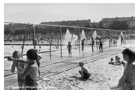
Natryski na basenie – abc.tychy.pl MMTy/F/1913/26